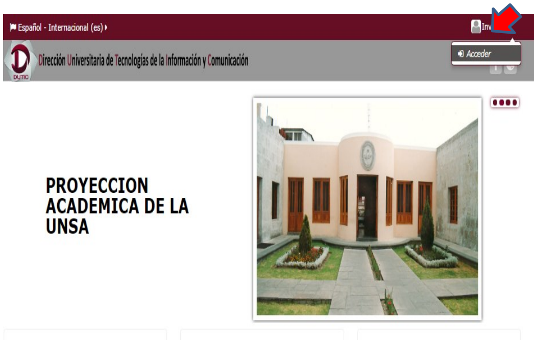
Figura 1: Página para acceder al Aula Virtual